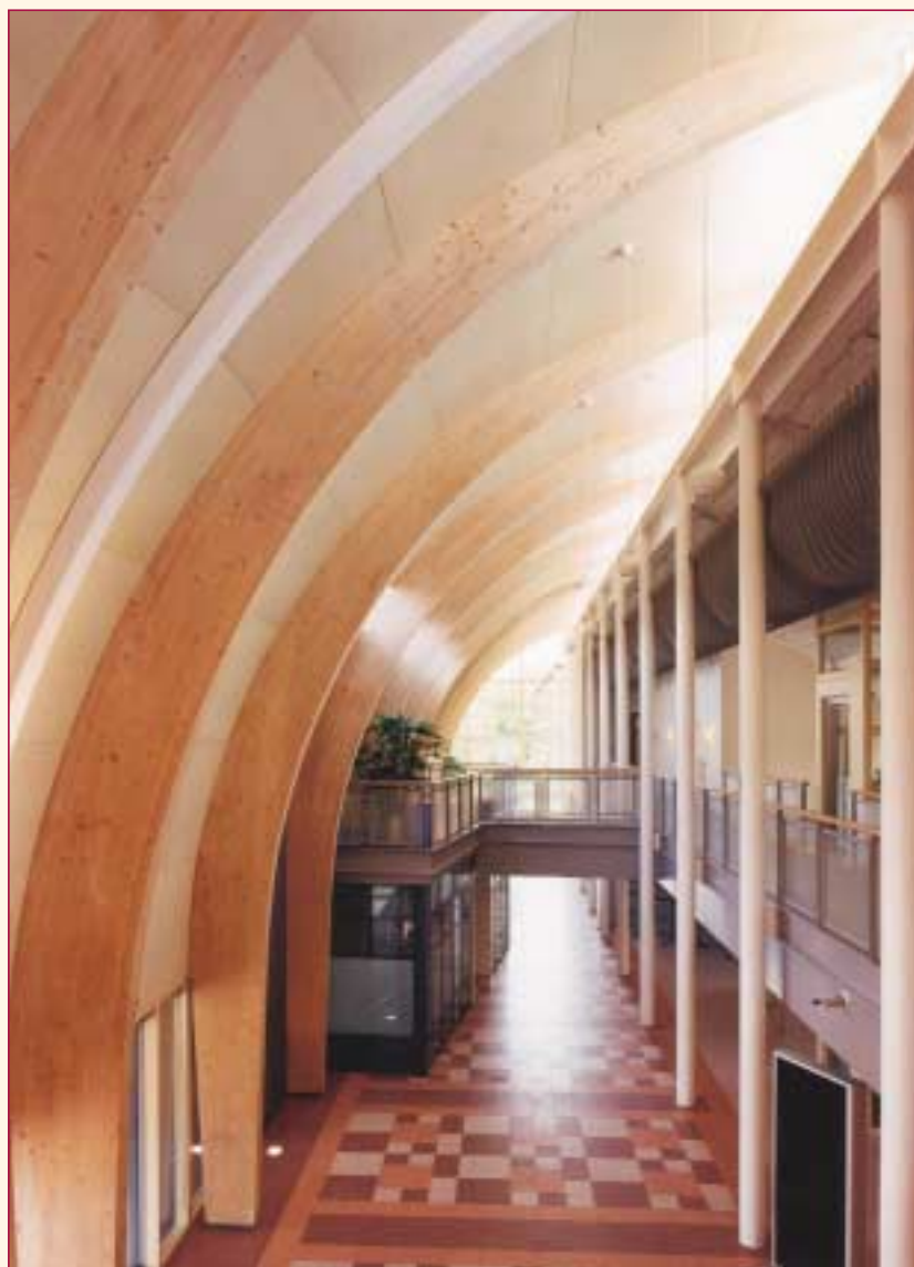
▷ 3. Als gebogen gelamineerde spanten in het raadhuis van Veere. Ontwerp: bd architectuur Leiden/Oosterbeek.