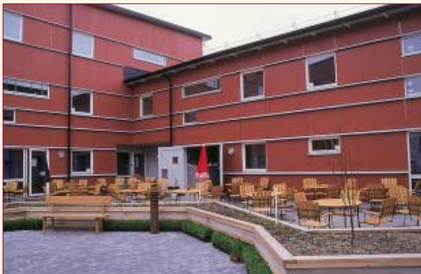
▷ 5. Het Trähus (drie houtskeletgebouwen) in Malmö is bekleed met een drielaagse plaat, waarvan de buitenste laag bestaat uit grenen, afgevoerd in noords rood. Ontwerp: Kim Dalgaard/Tue Traerup Madsen Kopenhagen.

De Zweedse naam voor grenen is 'furu' en voor vuren 'gran'. De door ons gebruikte namen zijn hiervan afgeleid. Waarom de namen zijn omgewisseld, blijft echter een mysterie. In de handel wordt de naam vaak aan het productiegebied gekoppeld. Zo kennen we Zweeds, Fins, Noors, Pools, Duits, Russisch en Oostenrijks grenen. Hoewel er in principe geen onderscheid in kwaliteit hoeft te bestaan, leggen deze toevoegingen toch een accent op de kwaliteit, met name wat de structuur betreft.