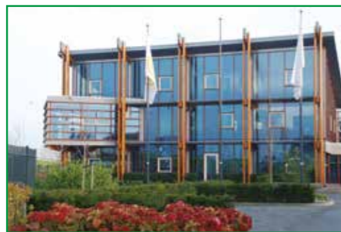
Gras Wood Wide Zaandam