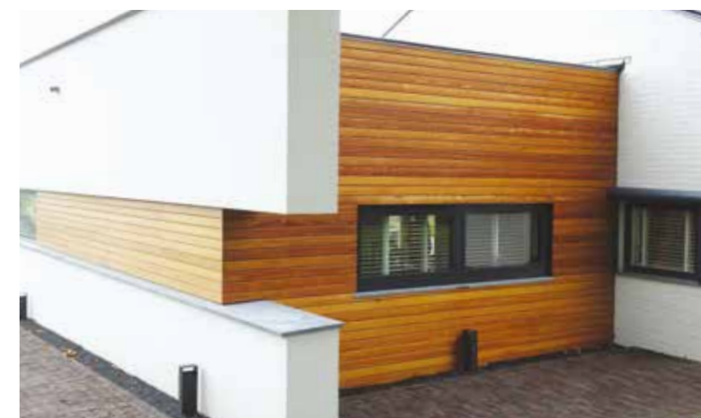
Villa met Cedar-Fix

De architect koos voor onze Cedar-Fix geveldelen voor zijn ontwerp van een landelijk gelegen villa, omdat hij de strakke en wit gestucte muren met een natuurlijk product wilde accentueren. De goede ventilatie van het Cedar-Fix systeem, het strakke uiterlijk en de snelle montage hebben zowel bij de opdrachtgever als de aannemer tot grote tevredenheid over het eindresultaat geleid.