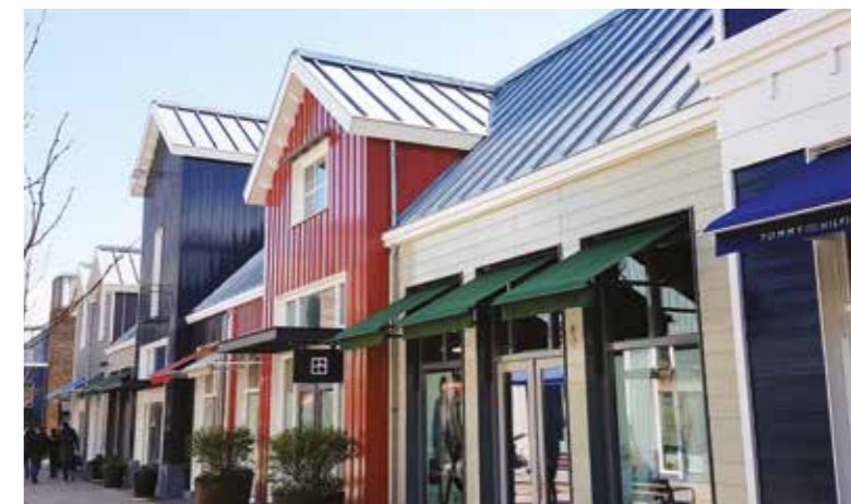
Batavia Stad - Fashion Outlet Lelystad

Attika architecten uit Amsterdam kozen bij dit ontwerp o.a. voor PureCedar, vanwege de gunstige kwaliteiten van dit hout. Het is makkelijk te verwerken, noestvrij, duurzaam en in iedere gewenste kleur af te werken.