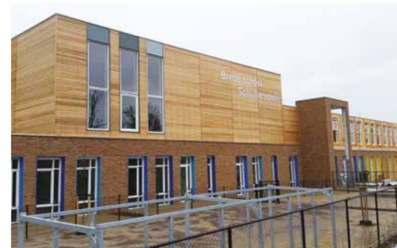
Brede school Gorinchem

DMV architecten uit Kerkrade kozen voor een PureCedar gevelbekleding, ondermeer om de school een warme uitstraling te geven, zodat kinderen naar hartenlust in een huiselijke omgeving kunnen leren en spelen.